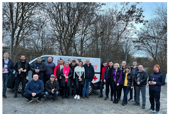
Ukrainer helfen dem DRK bei der Einrichtung der Sammelunterkunft