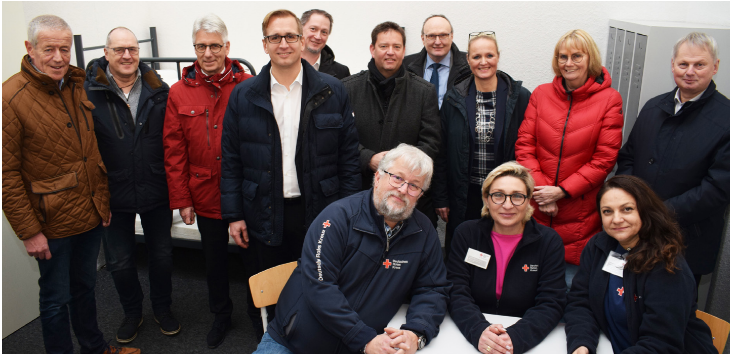
Bürgermeister besuchen die Sammelunterkunft

Die Sammelunterkunft in Brake ist seit dem 15.01.2023 betriebsbereit für Bewohner